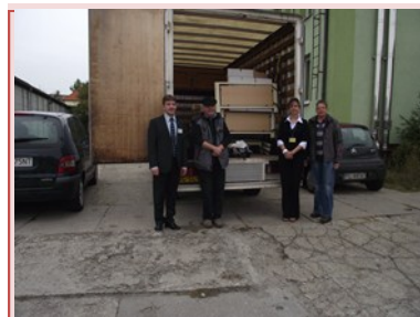
Bezoek PCPR Gostyń